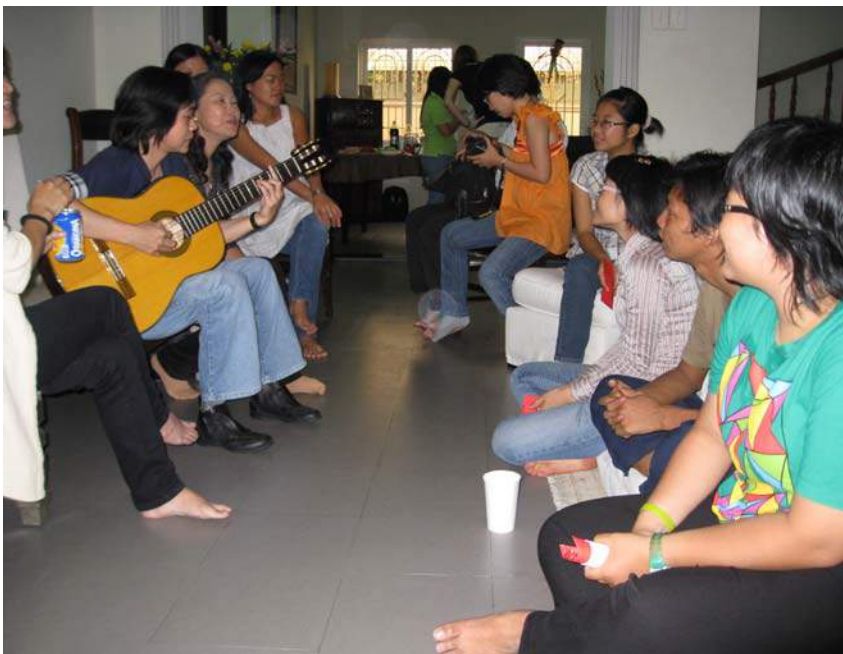
Đại diện các tổ chức cùng nhau hát các bài sinh hoạt và năm mới

Nhân dịp Tết nguyên đán 2010, đại diện các tổ chức phi lợi nhuận đối tác của Trung tâm LIN đã cùng tham gia buổi họp mặt tất niên mừng Năm Con Cọp. Mọi người đã cùng nấu nướng, chuẩn bị các món ăn nhẹ, cùng nhau trò chuyện chia sẻ những vui buồn, những khó khăn và thành công trong năm 2009.