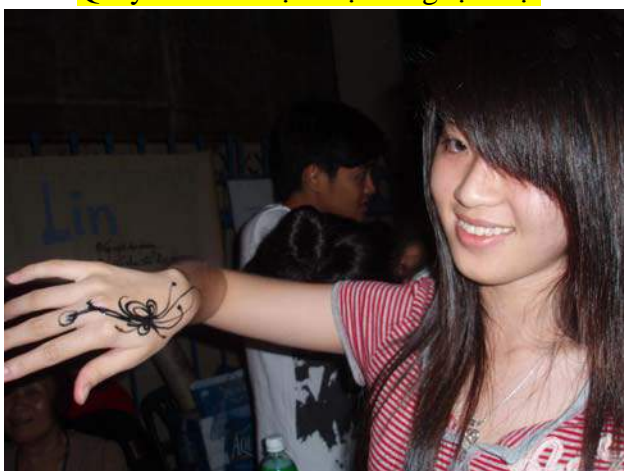
Hào hứng với hình vẽ nghệ thuật trên tay