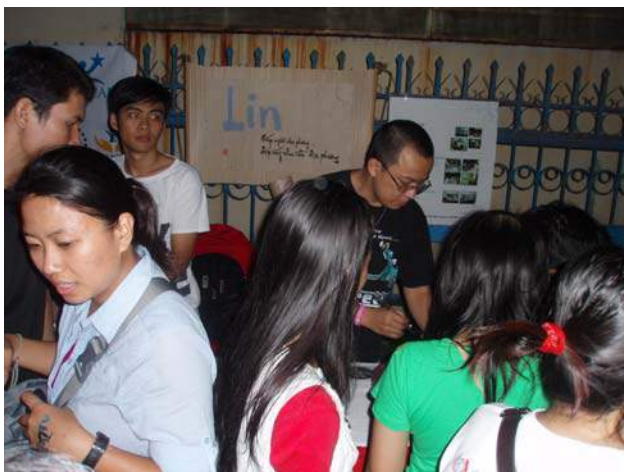
Quầy LIN với dịch vụ vẽ nghệ thuật