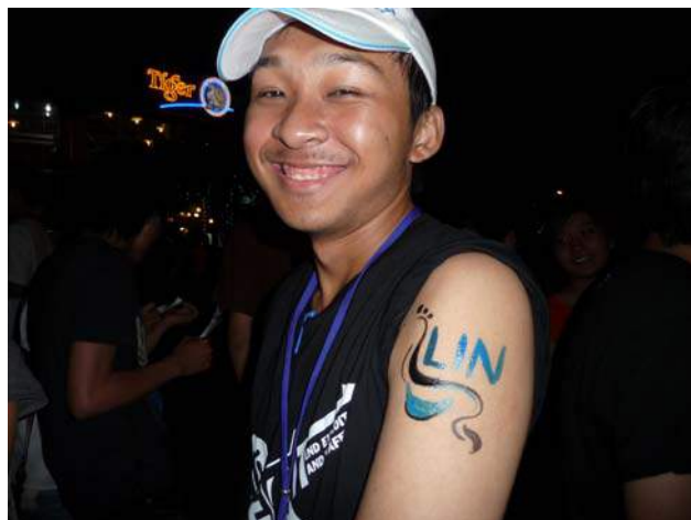
Một bạn trẻ thăm quầy LIN