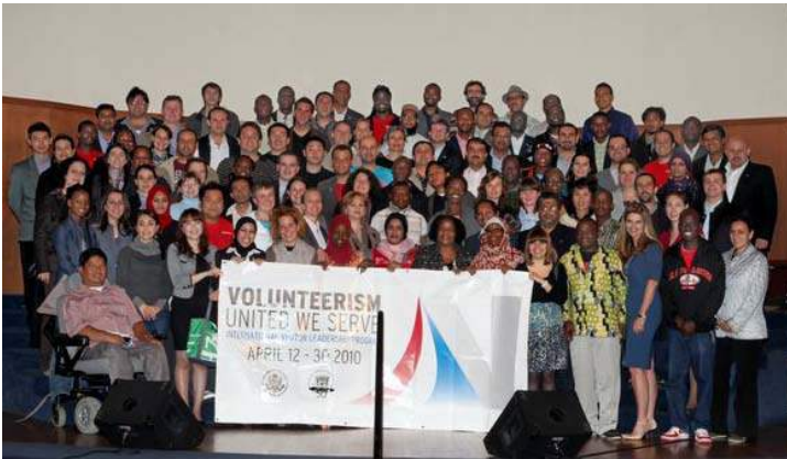
Tất cả thành viên chụp hình chung với bà Maria Shriver, đệ nhất phu nhân bang California (thứ 3 hàng dưới bên phải)