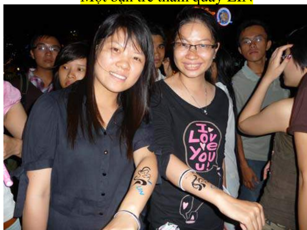
Hình vẽ logo MTV Exit cách điệu cùng logo LIN