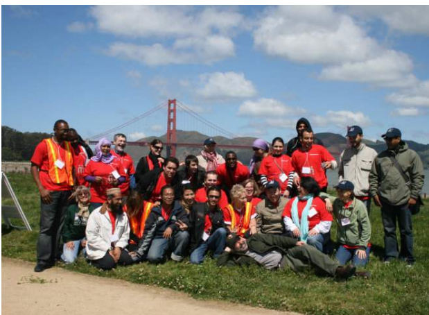
Tham gia tình nguyện tại công viên San Francisco

Qua tham quan và tiếp xúc trực tiếp với các tổ chức NPO/NGO cho thấy, mỗi nơi đều có phương pháp tổ chức việc tình nguyện chặt chẽ, có hệ thống thông qua các bản cam kết tình nguyện theo giờ, quản lý tính giờ công và công việc của tình nguyện viên.