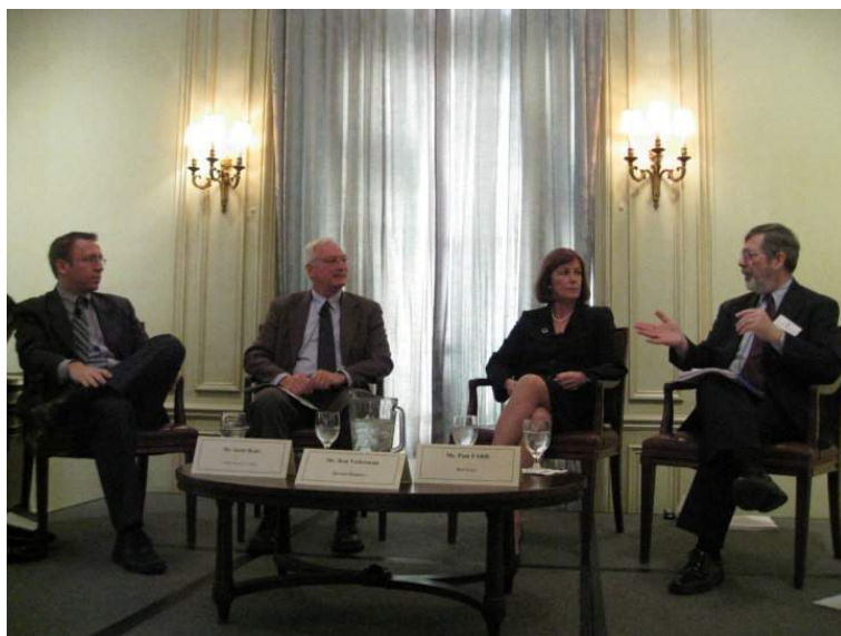
Đại diện các tổ chức NGO trình bày về dịch vụ của họ

Nhiều tổ chức phi lợi nhuận/ phi chính phủ tại Mỹ đã giới thiệu kinh nghiệm trong việc khuyến khích người dân tham gia phục vụ cộng đồng, đóng góp vào phúc lợi quốc gia cũng như tình nguyện tại các nước trên thế giới. Thông qua các diễn đàn và hội thảo giới thiệu chủ đề này, cho thấy nhà nước cũng như các đời tổng thống Mỹ đều nhận ra trách nhiệm của mình trong việc kêu gọi toàn dân tham gia phục vụ cộng đồng và xã hội. Điển hình là hiện tại đệ nhất phu nhân Mỹ, bà Michelle Obama, cam kết tham gia 100.000 giờ tình nguyện phục vụ cộng đồng cùng với các học sinh, sinh viên, thanh niên và mọi công dân Mỹ.