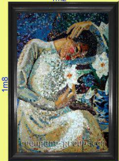
Cô gái Việt với hoa Huệ