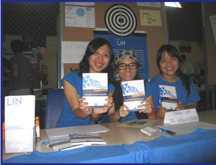
Đội ngũ LIN và tình nguyện viên tại quầy giới thiệu Trung tâm LIN

Ngày 12 tháng 3 năm 2011, Trung tâm LIN cùng với hơn 30 tổ chức phi lợi nhuận, các công ty trong nước và quốc tế đã tham gia Hội chợ Cộng đồng FOBISSEA, Liên minh các Trường Quốc tế Anh tại khu vực Đông Nam Á, được tổ chức trong khuôn viên trường Quốc tế Anh (BIS) tại Q. 2, TP.HCM.