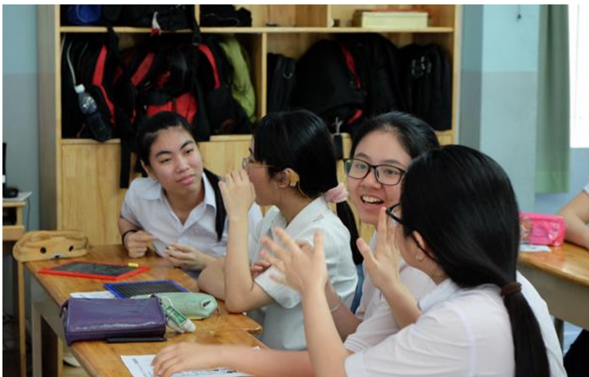
Ngôn ngữ ký hiệu - một ngôn ngữ thú vị mà ai trong chúng ta cũng có thể học để giao tiếp với người không nghe