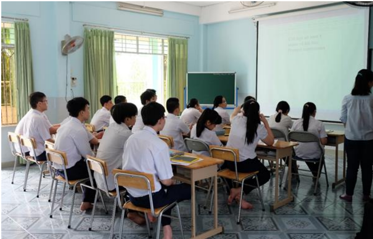
Các em chăm chú xem hướng dẫn được thầy giáo gõ trên màn chiếu

Và thế là, chúng tôi hào hứng đến thăm lớp học đặc biệt ấy.