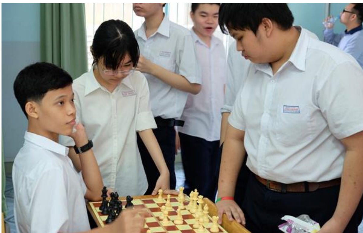
Cờ vua - Một trong các trò chơi yêu thích trong giờ giải lao của các em