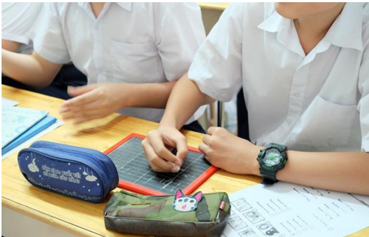
Bảng con chính là dụng cụ giao tiếp của các em với thầy cô và nhóm đi thăm lớp