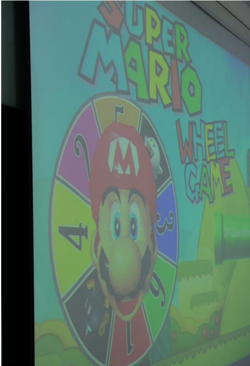
Những trò chơi đơn giản để khuyến khích các em làm bài tập sau khi học lý thuyết