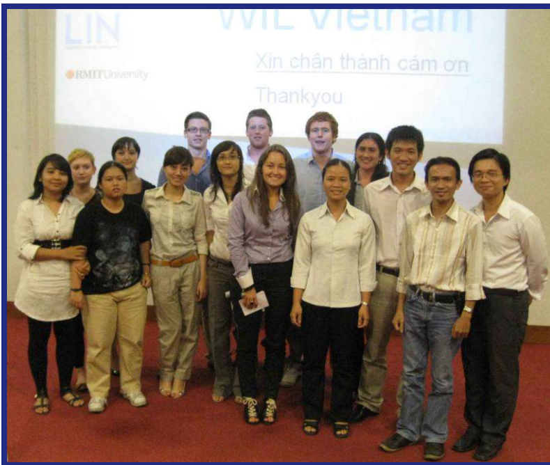
Các sinh viên RMIT chụp hình lưu niệm với đại diện Trung tâm LIN và mái ấm Nhật Hồng

Chiều ngày 22 tháng 02 năm 2011, Trung tâm LIN (đại diện cho CT Mồ Côi Khánh Hội), Chương trình Tình Thân và Mái ấm Nhật Hồng đã tham dự buổi báo cáo kết quả dự án WIL của các sinh viên Úc và Việt Nam đang theo học tại RMIT. Trong vòng 10 ngày từ 10/02/2011 đến 20/02/2011, các sinh viên đã đóng góp thời gian, kỹ năng, công sức và nỗ lực của mình để thực hiện các sản phẩm truyền thông và marketing cho các tổ chức được chọn tham gia dự án.