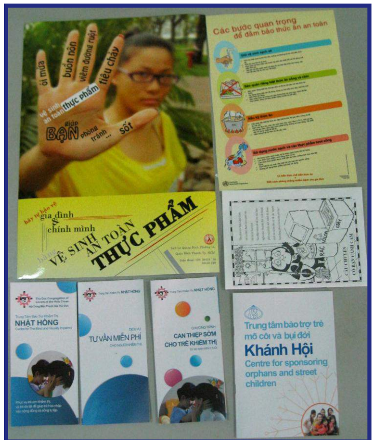
Các sản phẩm từ dự án WIL

Hội thảo về “thiết kế tài liệu marketing hiệu quả dành cho tổ chức phi lợi nhuận” trong tháng 3 (xem trang 4 phần hoạt động tháng tới trong bản tin này) sẽ có một đại diện từ nhóm các em học sinh RMIT chia sẻ kinh nghiệm của mình khi thực hiện dự án này.