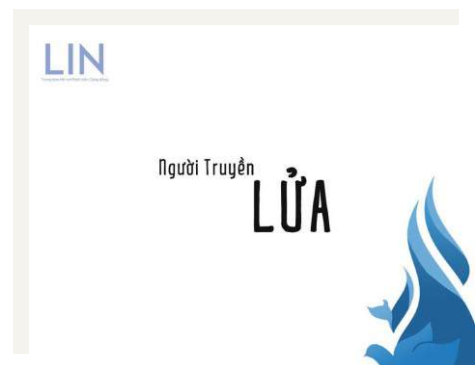
Bìa sách Người Truyền Lửa