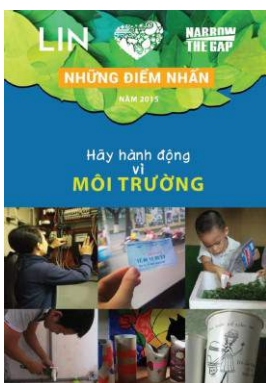
Báo cáo chiến dịch Rút ngắn Khoảng cách 2015 Xem toàn bộ thiết kế tại đây