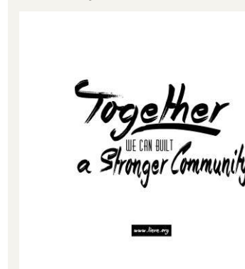
Túi lưu niệm