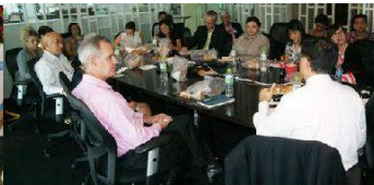
Tư vấn từ thiện chiến lược