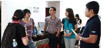
Xây dựng mạng lưới