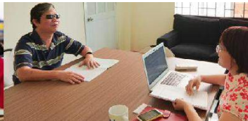
Kết nối TNV chuyên môn