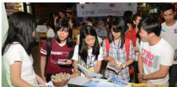
Quý Rút Ngắn Khoảng Cách