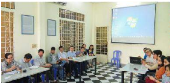
Trung tâm cộng đồng LIN

"Chúng tôi giúp người địa phương đáp ứng nhu cầu địa phương"