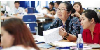
Nâng cao năng lực NPO